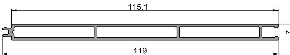
10781 Revestimiento tubular plano 5.820 kg/tira Largo: 6020 mm Bonificado